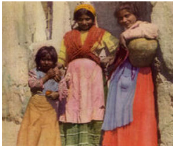
Imagen de archivo: mujeres gitanas, son una de las minorías más afectadas en Europa

El respeto a los derechos humanos, los refugiados y las minorías va en descenso en Europa. Un informe del comisario europeo de Derechos Humanos en Estrasburgo revela señales inquietantes.