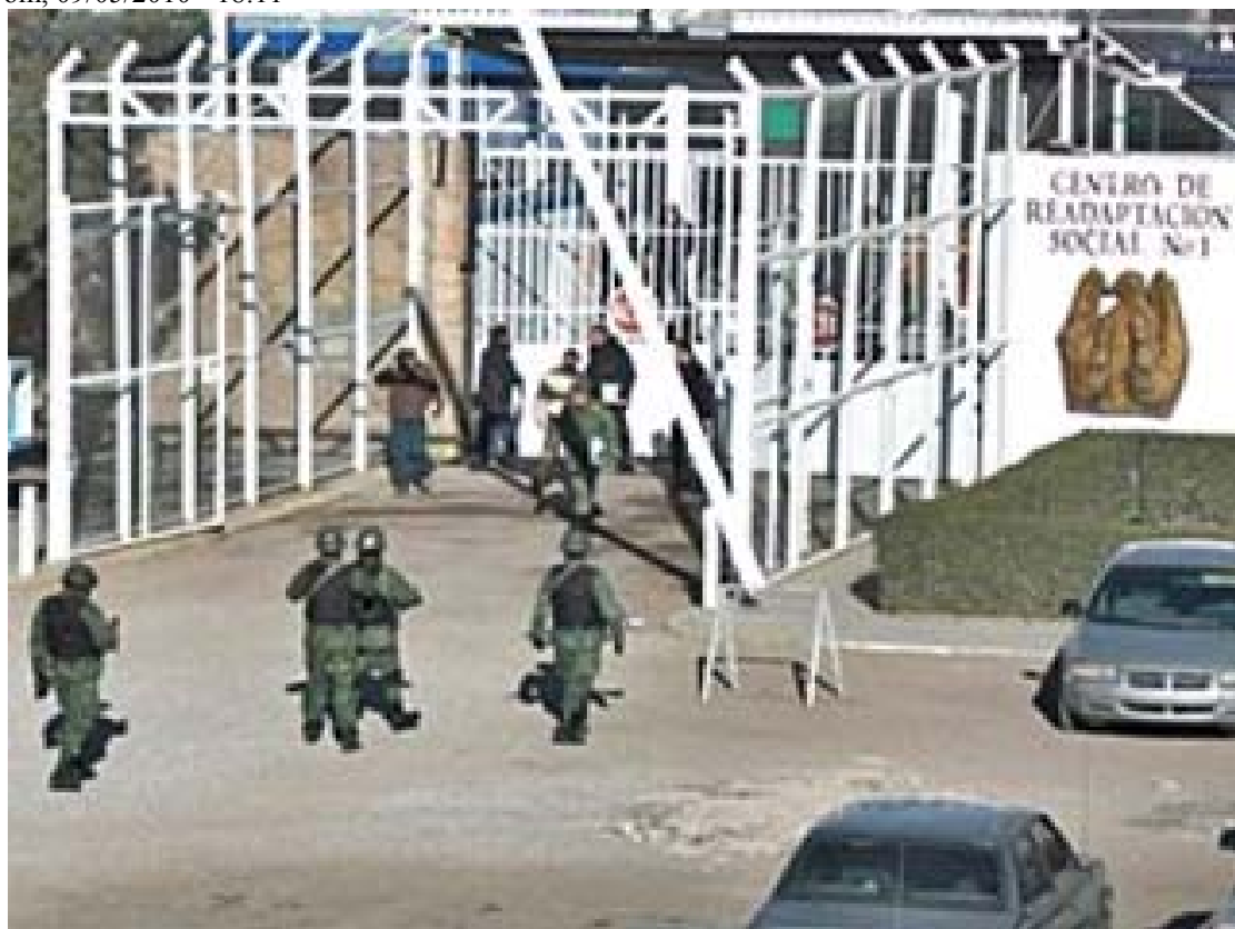
La Comisión Estatal de Derechos Humanos, hará revisiones en los centros penitenciarios de Durango