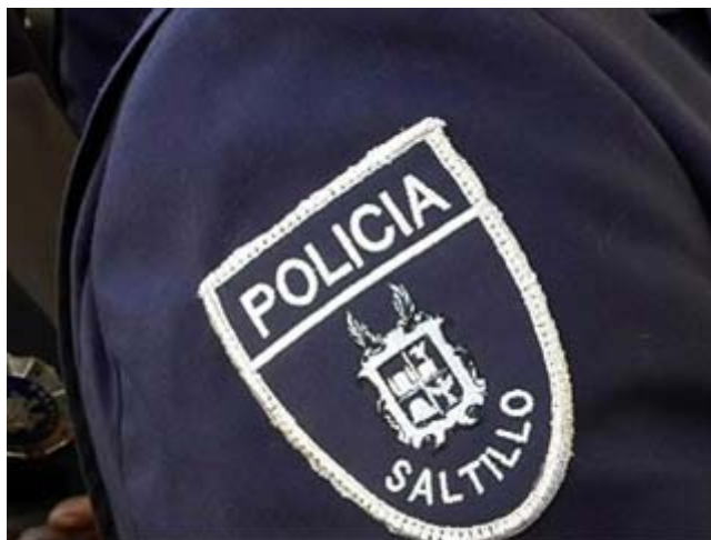
Dirección de Seguridad Pública de Saltillo.

Saltillo, Coahuila.- Aunque esgrimieron argumentos a su favor, la Fiscalía General del Estado y la Policía Preventiva Municipal de Saltillo dijeron que tomarán en consideración los reportes de la Comisión de Derechos Humanos del Estado de Coahuila dados a conocer el martes pasado.